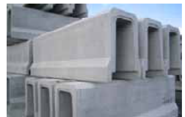
落ちふた式U形側溝3種本体、ふた