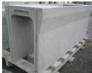
自由勾配(VS)側溝本体、ふた