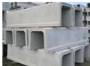
鉄筋コンクリート水路