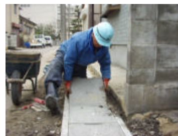
施工の労力が軽減します