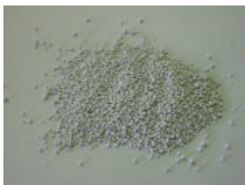
発泡廃ガラスを使用した軽量細骨材

→ セメントは、グリーン調達指定品目である高炉セメントを使用しています。また細骨材には、発泡廃ガラス(廃ガラスのリサイクル製品)を使用していますので地球環境にやさしいエコ商品です。