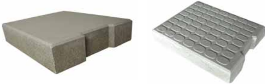
防音プレスふた製造適応サイズ

防音プレスふたは、プレスふたの底面に 軟質ポリ塩化ビニル製防音シート を埋め込み、ふたのガタツキ音を解消しました。既存の側溝など各種落ちふた式U形側溝のふたに使用できます。(JIS側溝、MUドレーン、MKドレーンなど。ただし、3種500サイズ以下に限定して対応いたします。)