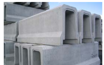
落ちふた式U形側溝3種本体、ふた