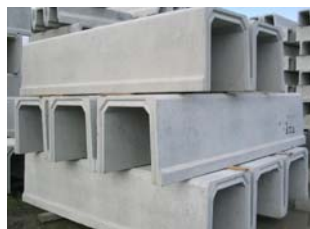
鉄筋コンクリート水路