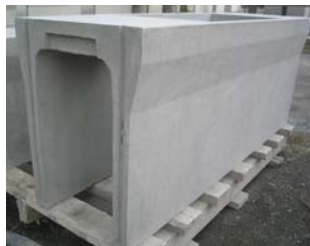
自由勾配(VS)側溝本体、ふた